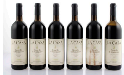
167 (38572) TENUTA CAPARZO, BRUNELLO DI MONTALCINO VIGNA LA CASA 1995 Toscana 5 bt, base del collo 1 bt, spalla media un'etichetta macchiata scatola originale di legno € 80/100