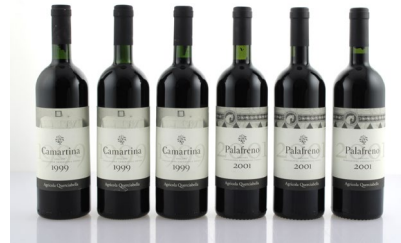
149 (38533) SELEZIONE QUERCIABELLA Toscana 3 bt Camartina 1999, 1 bt, collo, 2 bt, base del collo 3 bt Palafreno 2001, 2 bt, collo, 1 bt, base del collo € 200/220