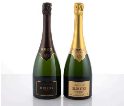
140 (38770) KRUG, LES CRÉATIONS DE 2008 Champagne 1 bt, Grande Cuvée 164ème Édition 1 bt, 2008 scatola originale in legno € 700/900