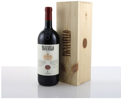
205 (38504) ANTINORI, TIGNANELLO 2020 Toscana 1 Mg, RP 98/100, collo, scatola originale di legno € 160/180