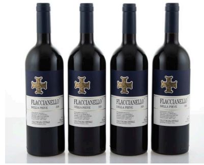
148 (38824) FONTODI, FLACCIANELLO DELLA PIEVE 2020 Toscana 4 bt, RP 98/100, collo scatola originale cartone € 300/400