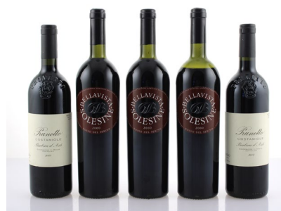
48 (38495) SELEZIONE ITALIA 2000 3 bt Bellavista, Solesine Rosso del Sebino 2000, 2 bt base del collo, 1 bt spalla media 2 bt Prunotto, Barbera d'Asti Costamiòle 2000, collo Offerta Libera