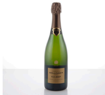
132 (38764) BOLLINGER, R. D. 2007 Champagne 1 bt, RP 97/100, collo € 150/250