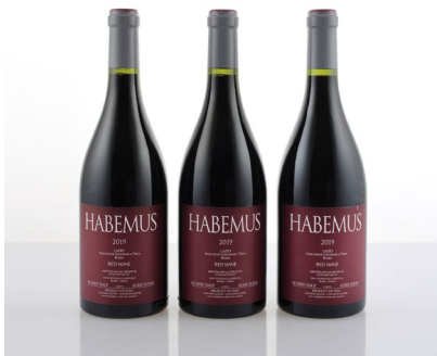
68 (38471) SAN GIOVENALE, HABEMUS ETICHETTA ROSSA 2019 Lazio 3 bt, collo € 180/220