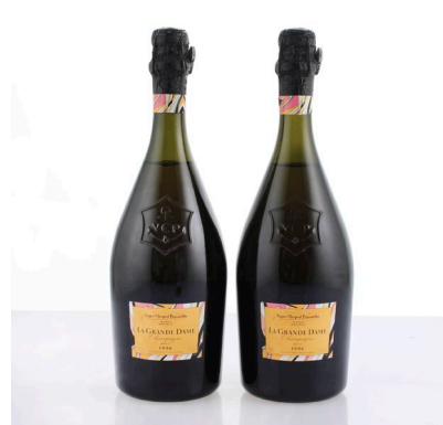
138 (38678) VEUVE CLIQUOT PONSARDIN, LA GRAND DAME 1996 Champagne, edizione limita Emilio Pucci 2bt, base del collo camicia isoterica € 280/350