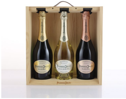
127 (38686) SELEZIONE PERRIER-JOUET, LES CLASSIQUES Champagne 1 bt Grand brut 1 bt Blanc de Blancs 1 bt Blason rosé scatola originale di legno € 150/200