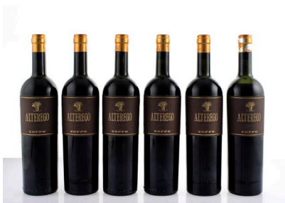
93 (38675) COPPO, ALTEREGO 1999 Piemonte 1 bt, spalla media 4 bt, base del collo 1 bt, spalla alta scatola originale in legno € 50/80