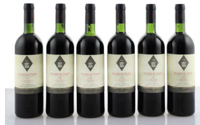
215 (38612) ANTINORI, TENUTA GUADO AL TASSO BOLGHERI SUPERIORE 1996 Bolgheri, Toscana 5 bt, base del collo 1 bt, spalla alta scatola originale di cartone € 450/550