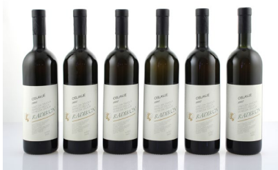
9 (38489) RADIKON, OSLAVJE BIANCO 1995 Friuli Venezia Giulia 2 bt collo 4 bt base del collo € 220/280