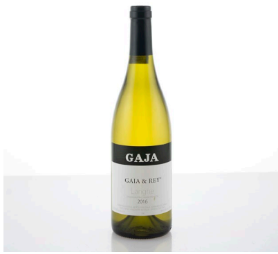
1 (38763) GAJA, GAJA E REY 2016 Piemonte 1 bt, RP 95/100, collo € 100/200