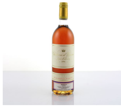
70 (38481) CHÂTEAU D'YQUEM 1991, LUR-SALUCES Sauternes 1 bt 75 cl, RP 89/100, base del collo € 250/300