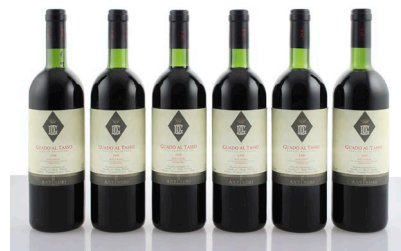
216 (38611) ANTINORI, TENUTA GUADO AL TASSO BOLGHERI SUPERIORE 1996 Bolgheri, Toscana 6 bt, base del collo scatola originale di cartone € 450/550