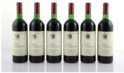
67 (38530) GUERRIERI GONZAGA, SAN LEONARDO 1996 Trentino 6 bt, base del collo scatola originale di cartone € 350/380