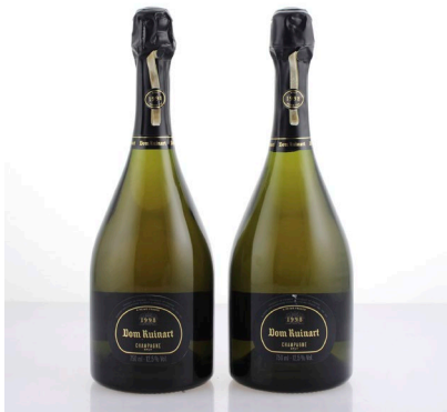
134 (38680) RUIART, DO M RUIART 1998 Champagne 2 bt, RP 96/100 scatole originali € 300/400