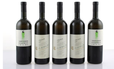
11 (38492) SELEZIONE FRIULI VENEZIA GIULIA 3 bt Radikon, Oslavje Bianco 1995, 2 bt base del collo, 1 bt collo 2 bt Gravner Sauvignon 1994, collo € 180/220