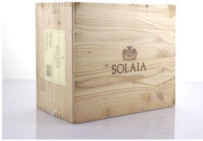
211 (38643) ANTINORI, SOLAIA 2003 Toscana 6 bt, RP 93/100 scatola originale di legno sigillata € 1.000/1.200