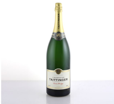
128 (38687) TAITTINGER, CUVÉE PRESTIGE Champagne 1 jb (3 lt) scatola originale di legno € 150/180