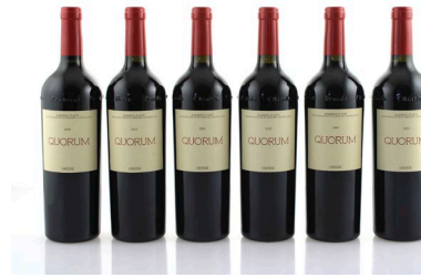
94 (38519) HASTAE, QUORUM BARBERA D'ASTI 2003 Piemonte 6 bt, collo cassa originale in legno € 200/250