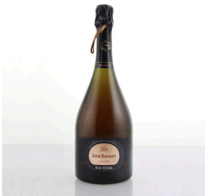
135 (38679) RUIART, DO M RUIART ROSÉ 1996 Champagne 1 bt scatola originale € 150/200