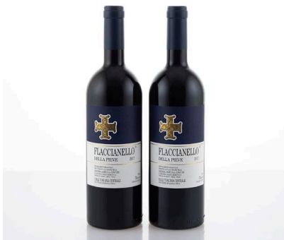
147 (38767) FONTODI, FLACCIANELLO DELLA PIEVE 2017 Toscana 2 bt, RP 96/100, collo € 150/250