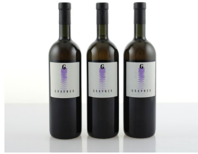
4 (38497) GRAVNER, BREG BIANCO 1995 Friuli Venezia Giulia 3 bt, base del collo € 220/280