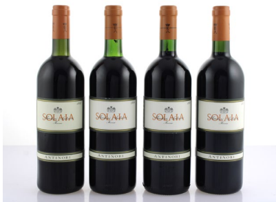
207 (38646) SELEZIONE ANTINORI, SOLAIA Toscana 1 bt 1997, base del collo, RP 96/100 2 bt 1998, 1 bt base del collo, 1 bt collo, RP 93/100 1 bt 2001, collo, RP 96/100 € 600/700