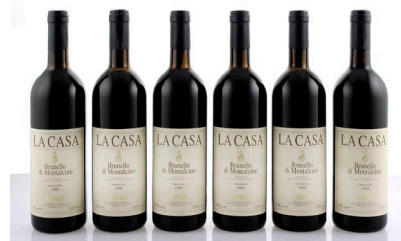
168 (38571) TENUTA CAPARZO, BRUNELLO DI MONTALCINO VIGNA LA CASA 1995 Toscana 4 bt, base del collo 2 bt, spalla alta scatola originale di legno € 80/100