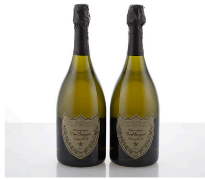
142 (38765) DOM PÉRIGNON, 2010 Champagne 2 bt, RP 92/100, collo scatole originali € 300/400