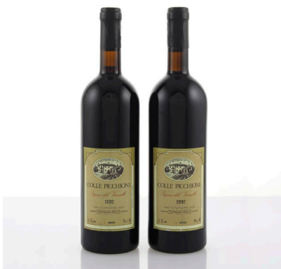
45 (38450) COLLE PICCHIONI, VIGNA DEL VASSALLO 1992 Lazio 1 bt, collo 1 bt, base del collo Offerta Libera