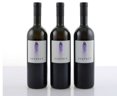
5 (38498) GRAVNER, BREG BIANCO 1995 Friuli Venezia Giulia 3 bt, base del collo € 220/280