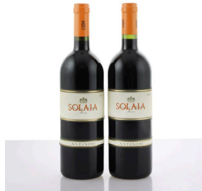
210 (38731) SELEZIONE ANTINORI, SOLAIA Toscana 1 bt 2003, collo, RP 93/100 1 bt 2004, collo, RP 96/100 etichette lievemente usurate € 300/400