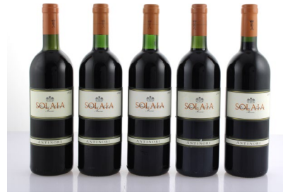
208 (38647) SELEZIONE ANTINORI, SOLAIA Toscana 1 bt 1997, base del collo, RP 96/100 2 bt 1998, base del collo, RP 93/100 1 bt 2000, base del collo, RP 96/100 1 bt 2001, collo, RP 96/100 € 800/900