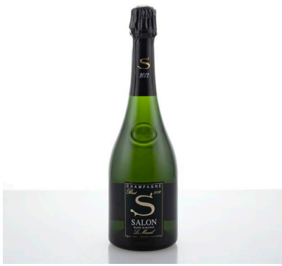
145 (38823) SALON, LE MESNIL 2012 Champagne 1 bt, RP 95/100, collo scatola originale di legno € 600/800