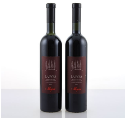
44 (38456) ALLEGRINI, LA POJA 2004 Veneto 1 bt, spalla alta 1 bt, collo € 80/100