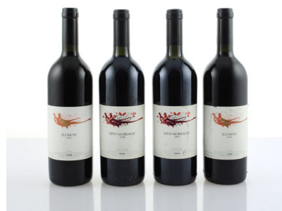
78 (38502) SELEZIONE GAJA Piemonte 2 bt Illusion 1996, 1 bt collo, 2 bt base del collo, un'etichetta lievemente usurata 2 bt Sito Moresco 1999, base del collo, etichette lievemente usurate € 60/80