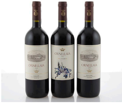
163 (38768) ORNELLAIA 2019 Bolgheri, Toscana 2 bt, RP 97/100, collo 1 bt "Vigore", collo scatola originale di legno € 400/600