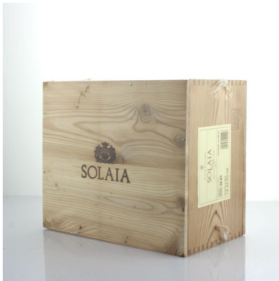
212 (38642) ANTINORI, SOLAIA 2003 Toscana 6 bt, RP 93/100 scatola originale di legno sigillata € 1.000/1.200