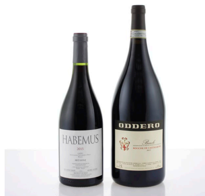
47 (38755) SELEZIONE ITALIA Italia 1 bt San Giovenale Habemus etichetta bianca 2015, collo 1 Mg Oddero Barolo Rocche di Castiglione 2012, collo scatole originali legno € 80/120