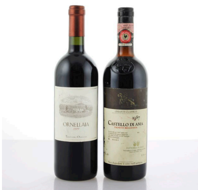
165 (38742) SELEZIONE TOSCANA 1 bt Ornellaia 1999, collo, RP 94/100 1 bt Castello di Ama, Chianti Classico, Vigneto Bellavista 1987, base del collo, n. 08364 € 150/180