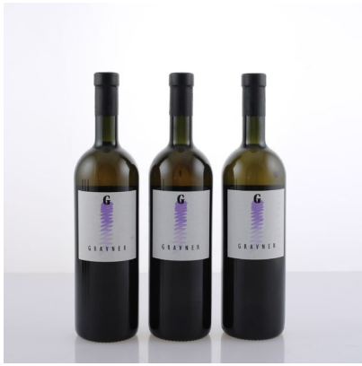
7 (38496) GRAVNER, BREG BIANCO 1995 Friuli Venezia Giulia 3 bt, base del collo 0 € 220/280