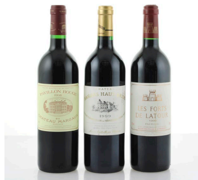
72 (38744) SELEZIONE BORDEAUX Bordeaux 1 bt Chateau Latour, Les forts de Latour 1999, collo 1 bt Chateau Margaux, Pavillon Rouge 1998, collo 1 bt Chateau Bahans Haut-Brion 1999, collo € 180/250