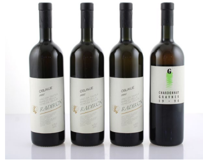
10 (38490) SELEZIONE FRIULI VENEZIA GIULIA Friuli Venezia Giulia 1 bt Gravner, Chardonnay 1994, base del collo 3 bt, Radikon, Oslavje Bianco 1995, base del collo € 140/160