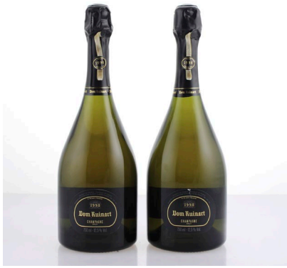
133 (38681) RUIART, DO M RUIART 1998 Champagne 2 bt, RP 96/100 scatole originali € 300/400