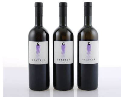
6 (38499) GRAVNER, BREG BIANCO 1995 Friuli Venezia Giulia 3 bt, base del collo 0 € 220/280