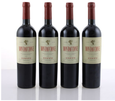
91 (38461) COPPO, MONDACCIONE 1997 Piemonte 4 bt, base del collo Offerta Libera