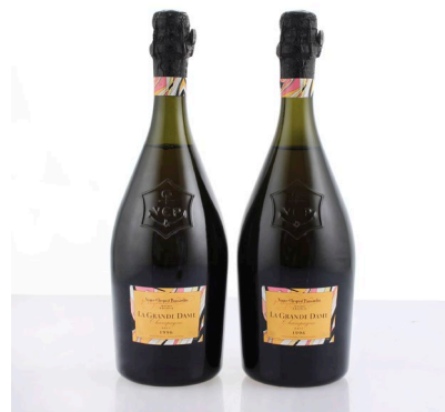
137 (38676) VEUVE CLIQUOT PONSARDIN, LA GRAND DAME 1996 Champagne, edizione limita Emilio Pucci 2bt, base del collo camicia isoterica € 280/350