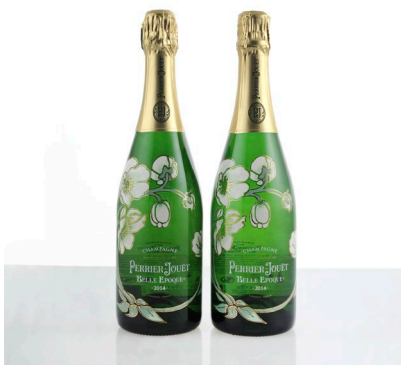
129 (38685) PERRIER-JOUET, BELLE EPOQUE 2014 Champagne 2 bt, RP 91/100 scatole originali € 200/250