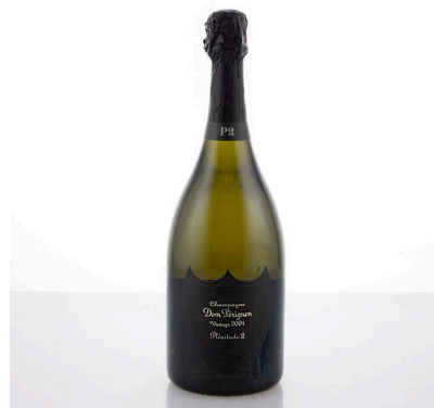
144 (38758) DOM PÉRIGNON, P2 2004 Champagne 1 bt RP 97/100, collo € 300/400