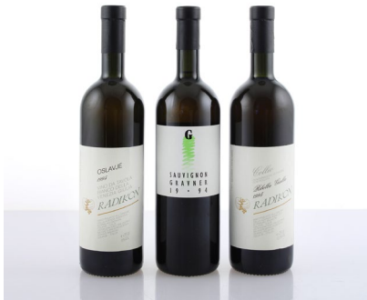
8 (38494) SELEZIONE FRIULI VENEZIA GIULIA Friuli Venezia Giulia 1 bt Radikon, Oslavje Bianco 1995, base del collo 1 bt Radikon, Ribolla Gialla 1995, base del collo 1 bt Gravner, Sauvignon 1994, collo € 100/150