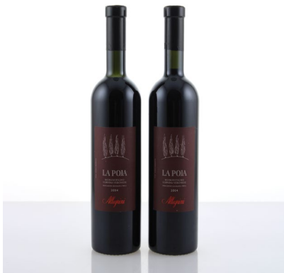
43 (38457) ALLEGRINI, LA POJA 2004 Veneto 1 bt, collo 1 bt, base del collo € 80/100