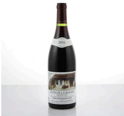
74 (38734) GÉRARD RAPHET, CLOS DE LA ROCHE GRAND CRU 2016 Borgogna 1 bt, collo € 150/200