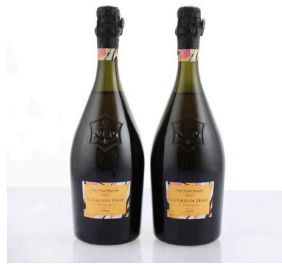
136 (38677) VEUVE CLIQUOT PONSARDIN, LA GRAND DAME 1996 Champagne, edizione limita Emilio Pucci 2bt, base del collo camicia isoterica € 280/350