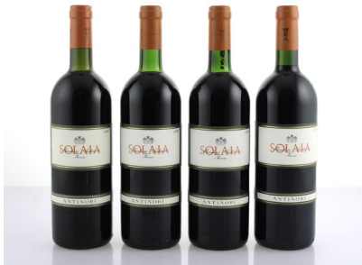
206 (38645) SELEZIONE ANTINORI, SOLAIA Toscana 1 bt 1997, base del collo, RP 96/100 2 bt 1998, base del collo, RP 93/100 1 bt 2001, collo RP 96/100 € 600/700