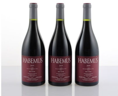
69 (38470) SAN GIOVENALE, HABEMUS ETICHETTA ROSSA 2019 Lazio 3 bt, collo € 180/200