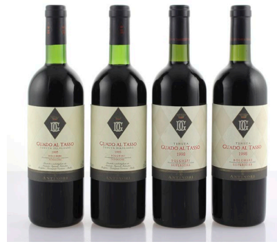
214 (38615) SELEZIONE ANTINORI, TENUTA GUADO AL TASSO BOLGHERI SUPERIORE Bolgheri, Toscana 2 bt 1995, base del collo, RP 89/100 2 bt 1998, base del collo, RP 94/100 € 300/350