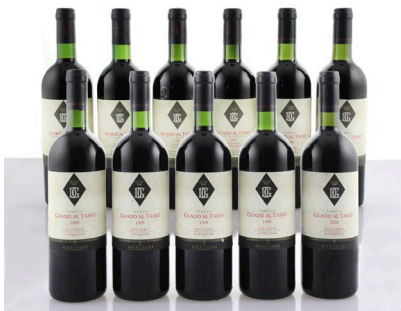
213 (38616) SELEZIONE ANTINORI, TENUTA GUADO AL TASSO BOLGHERI SUPERIORE Bolgheri, Toscana 2 bt 1995, base del collo, RP 89/100 2 bt 1997, base del collo, RP 94/100 2 bt 1998, base del collo, RP 94/100 4 bt 1999, base del collo, RP 94/100 1 bt 2000, base del collo € 700/800