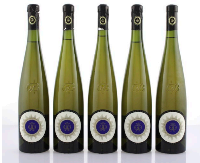
2 (38526) BELLAVISTA, CHARDONNAY CONVENTO DELLA SANTISSIMA ANNUNCIATA 1997 Lombardia 3 bt, collo 2 bt, base del collo cassa originale di legno € 80/120