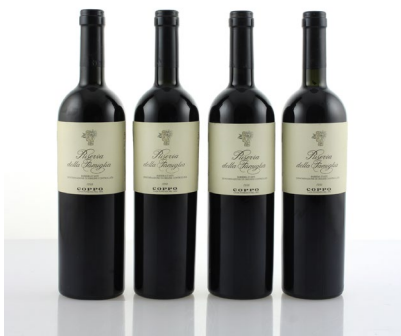
92 (38463) COPPO, BARBERA D'ASTI RISERVA DELLA FAMIGLIA 1998 Piemonte 3 bt, base del collo 1 bt, collo € 250/300