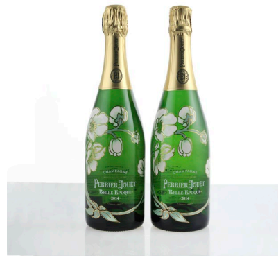
130 (38684) PERRIER-JOUET, BELLE EPOQUE 2014 Champagne 2 bt, RP 91/100 scatole originali € 200/250