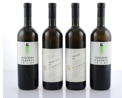
12 (38493) SELEZIONE FRIULI VENEZIA GIULIA 1 bt Radikon, Oslavje Bianco 1995, base del collo 1 bt Radikon, Ribolla Gialla 1995, base del collo 2 bt Gravner, Sauvignon 1994, base del collo € 150/200