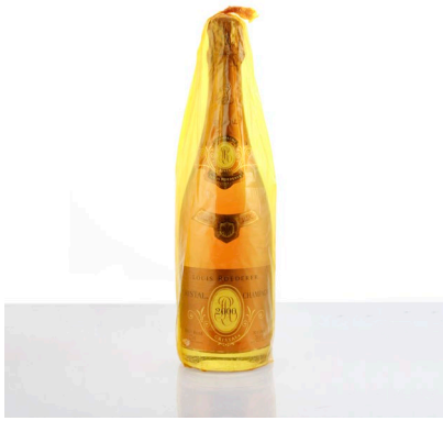
139 (38682) LOUIS ROEDERER, CRISTAL ROSÉ 2000 Champagne 1 bt, RP 95/100 scatola originale € 400/600