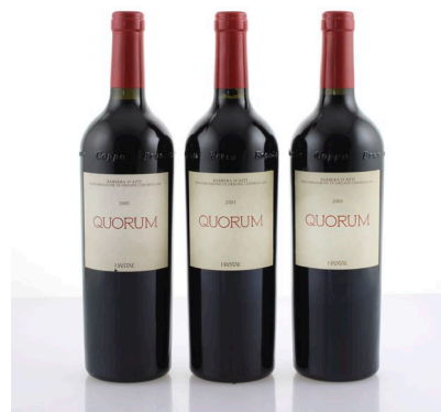
95 (38520) HASTAE, QUORUM BARBERA D'ASTI 2003 Piemonte 3 bt, collo € 80/120