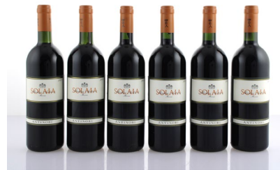
209 (38644) ANTINORI, SOLAIA 2001 Toscana 6 bt, RP 96/100 4 bt, collo 2 bt, base del collo scatola originale di cartone € 1.000/1.200