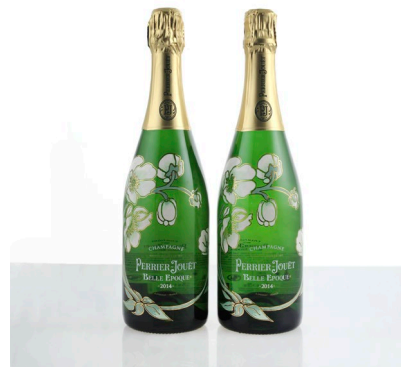
131 (38683) PERRIER-JOUET, BELLE EPOQUE 2014 Champagne 2 bt, RP 91/100 scatole originali € 200/250