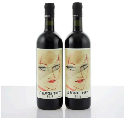
146 (38729) MONTEVERTINE, LE PERGOLE TORTE 2018 Toscana 2 bt, collo RP 90/100 € 250/350