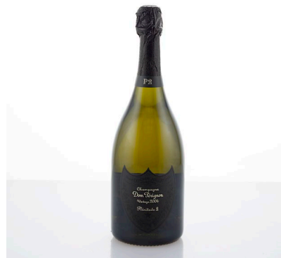
143 (38757) DOM PERIGNON, P2 2004 Champagne 1 bt RP 97/100, collo € 300/400