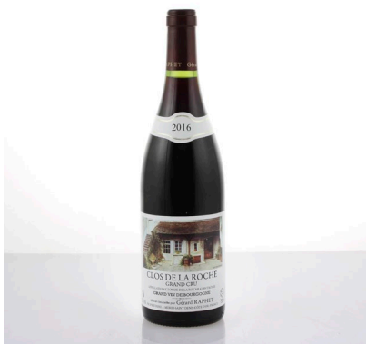
75 (38733) GÉRARD RAPHET, CLOS DE LA ROCHE GRAND CRU 2016 Borgogna 1 bt, collo € 150/200