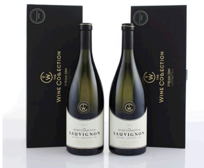
3 (38529) ST. MICHAEL EPPAN, SAUVIGNON THE WINE COLLECTION 2015 Alto Adige 2 bt, collo scatole originali € 150/170