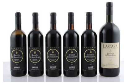
166 (38575) SELEZIONE TENUTA CAPARZO, BRUNELLO DI MONTALCINO Toscana 1 Mg Vigna La Casa 1997, collo 3 bt Riserva 1993, base del collo 2 bt Riserva 1990, 1 bt, base del collo, 1 bt, spalla media € 80/100