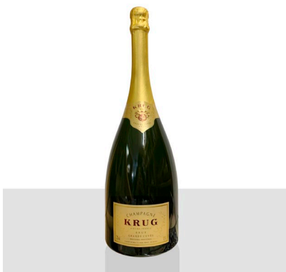
141 (38772) KRUG, GRANDE CUVÉE EDIZIONE FIORELLINI Champagne 1 mg, scatola originale € 300/400