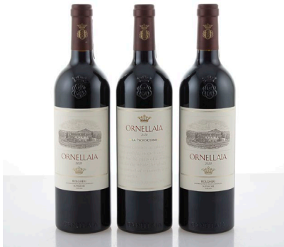
164 (38769) ORNELLAIA 2020 Bolgheri, Toscana 2 bt, RP 97/100, collo 1 bt "Proporzione", collo scatola originale di legno € 400/600