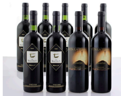
46 (38669) SELEZIONE ITALIA 9 bt, La Braccasca Merlot 1998, base del collo 4 bt, Tenuta La Tenaglia Paradiso 1995, base del collo € 100/150