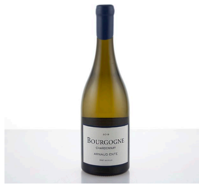
76 (38762) ARNAUD ENTE, BOURGOGNE CHARDONNAY 2019 Borgogna 1 bt, collo € 150/250