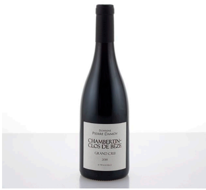
73 (38761) DOMAINE PIERRE DAMOY, CHAMBERTIN CLOS DE BÈZE GRAND CRU 2018 Borgogna 1 bt, RP 95/100, collo € 500/700