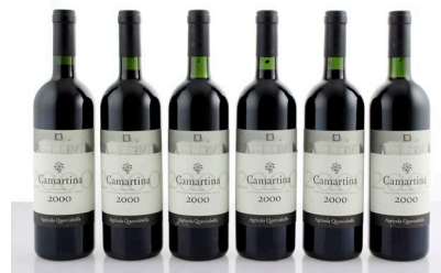
150 (38541) QUERCIABELLA, CAMARTINA 2000 Toscana 4 bt, collo 2 bt, base del collo cassa originale di legno € 140/160