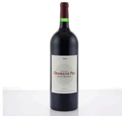
71 (38756) CHATEAU ORMES DE PEZ 2010 Bordeaux 1 Mg, collo scatola originale di legno € 50/100