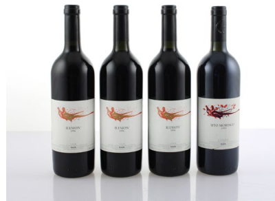
77 (38500) SELEZIONE GAJA Piemonte 3 bt Illusion 1996, 2 bt collo, 1 bt base del collo 1 bt Sito Moresco 1999, base del collo € 60/80